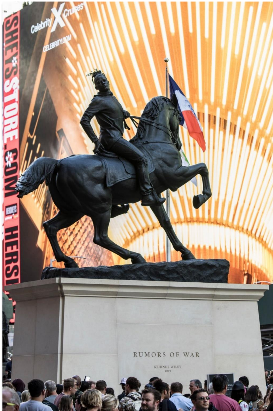
Figura 7: Rumores da Guerra.

Dentre as esculturas do artista Kehinde Wiley, conhecido por produzir retratos aristocráticos de homens afro-americanos, Rumores da Guerra é a sua maior até então, tendo sido inspirada nas estátuas dos confederados mais famosos da Virgínia. Conforme percebe Ugwu (2019), o jovem retratado sobre seu cavalo se parece com alguém perdido no tempo, sugerindo-nos uma reflexão sobre sua procedência: seria ele do século passado ou um viajante do futuro?