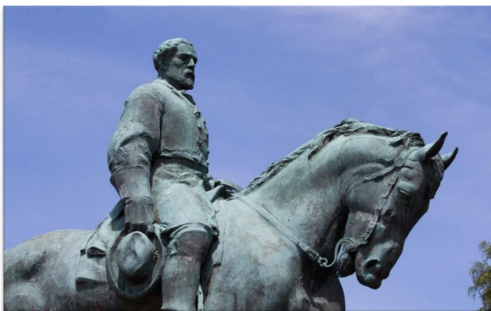
Figura 1: O monumento em disputa.

estátua do general Robert Edward Lee, confederado ícone da Guerra de Secessão e notório escravocrata (Figura 1). O embate foi configurado nos seguintes moldes: de um lado, o ativismo humanitário questionava a permanência pública de um símbolo de dominação racial; do lado oposto, grupos favoráveis à permanência do monumento consideravam a possibilidade de sua remoção como uma injúria grave à história da nação. Na ocasião, representantes da irmandade Ku Klux Klan e outros grupos de extrema direita empunharam seus símbolos, portaram bandeiras confederadas e entoaram slogans nazistas, defendendo, assim, a integridade do que se chamou de uma “herança europeia pura”.